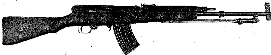
Abbildung. 2: „Modell 68“, Ansicht linke Seite