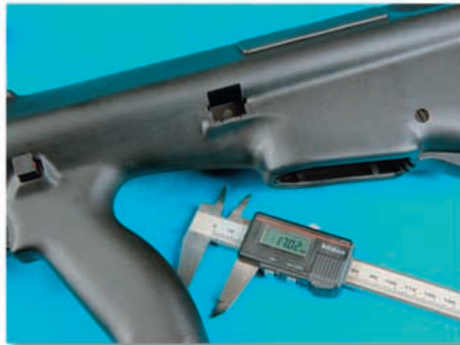
Der Demontageriegel des Gehäuses mißt bei der Z-Version 17 mm anstatt 20 mm des Originals.

verkleinert werden. Für diese Steigerung des Schußleistungsniveaus dürfte unserer Ansicht nach vor allem auch die ausgeklügelte Gasabschneidhülle aus hoch legiertem, rostträgem Stahl in der Geschoßaustrittsbohrung verantwortlich sein. Die Montage der Heckbereich geschlitzten Mündungsbremse mittels der vier Klemmschrauben ist denkbar einfach, und Armin Ebinger bietet seine effektiv wirkenden Kamps für verschiedene Laufdurchmesser an,