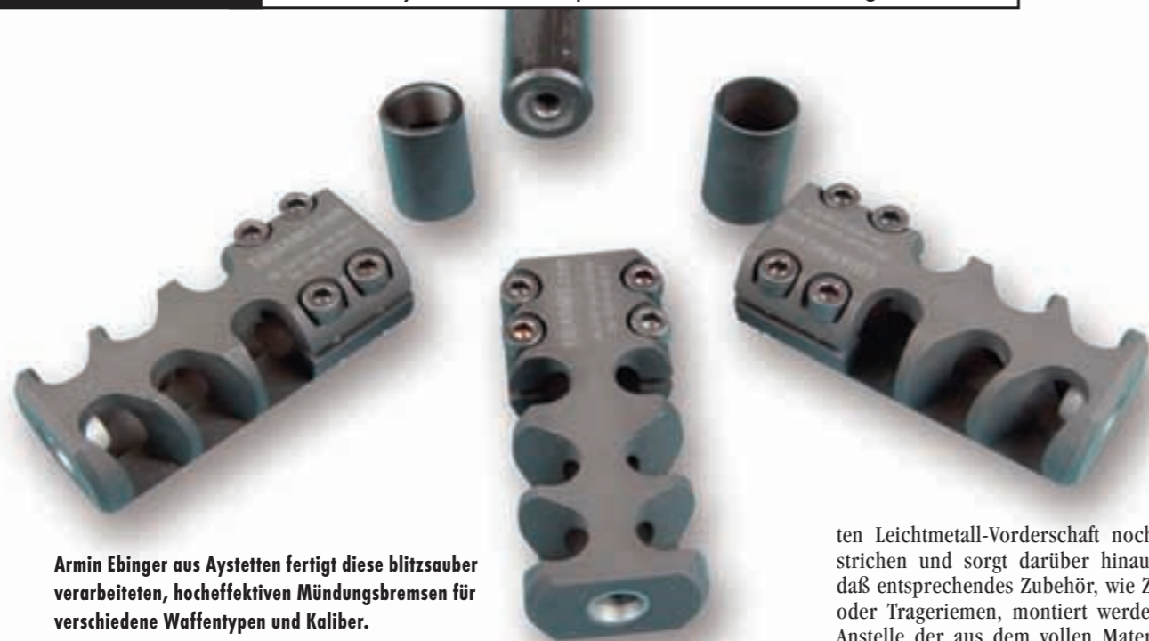
Armin Ebinger aus Aystetten fertigt diese blitzsauber verarbeiteten, hocheffektiven Mündungsbremsen für verschiedene Waffentypen und Kaliber.

ten Leichtmetall-Vorderschaft noch unterstrichen und sorgt darüber hinaus dafür, daß entsprechendes Zubehör, wie Zweibein oder Trageriemen, montiert werden kann. Anstelle der aus dem vollen Material herausgearbeiteten Weaverschiene des OA-UG Sport besitzt die Z-Sport eine demontierbare Schiene, was unter Umständen das Schießen im freihändigen Anschlag bequemer gestaltet. Die vertikalen Greifrillen des exakt auf die Systemkontur abgestimmten