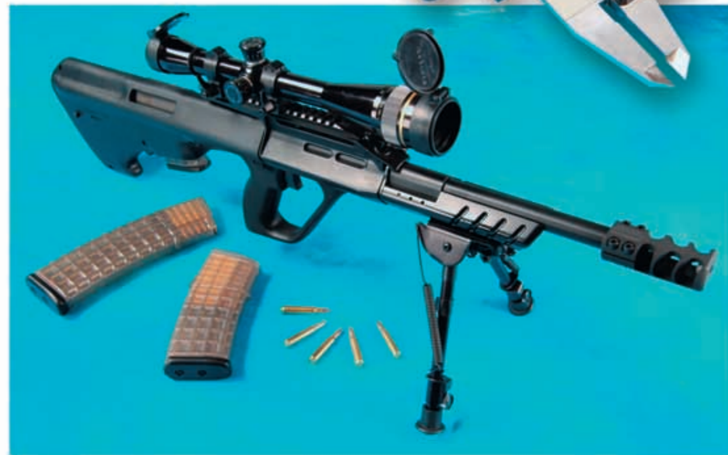
Aufgerüstetes Steyr AUG-Z Sport in der Seitenansicht.

Die Verschußführung wurde um einen Millimeter von 5,2 mm auf 4,2 mm reduziert.