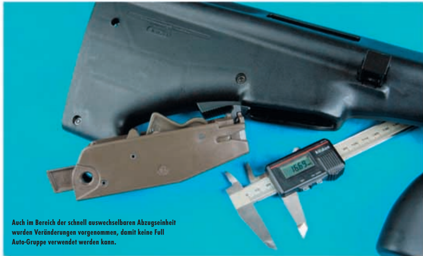
Auch im Bereich der schnell auswechselbaren Abzugseinheit wurden Veränderungen vorgenommen, damit keine Full Auto-Gruppe verwendet werden kann.