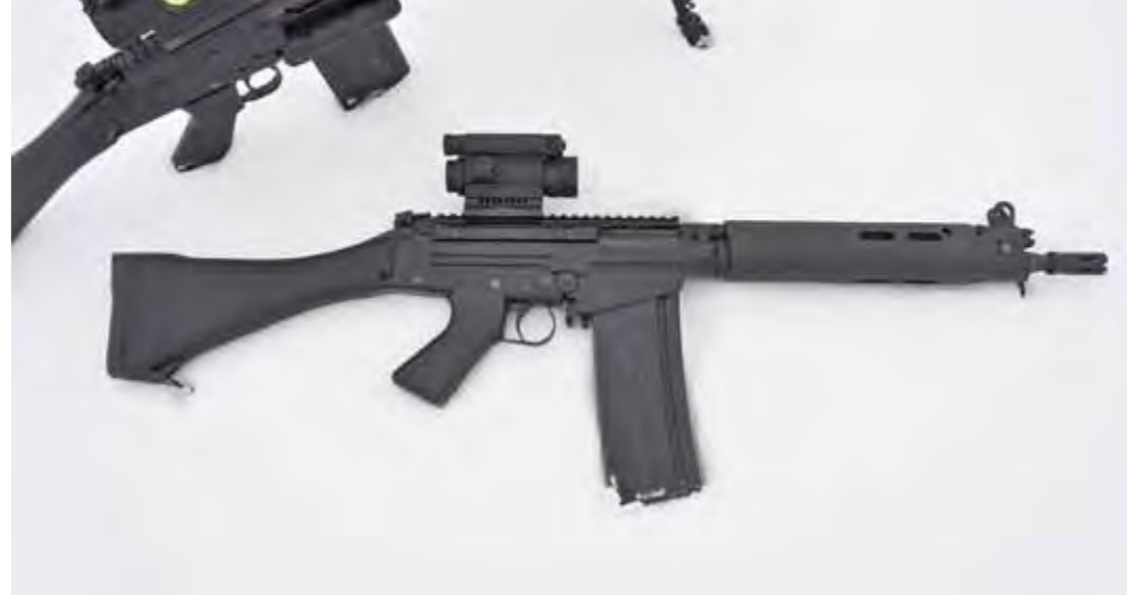
Oben, unten: Getestet haben wir sowohl das LIAI-LDT mit 55 cm Lauf mit 1:12 Drall als auch das LIAI-LDT Compact, das als Kurzversion über einen 36-cm-Lauf verfügt. Beide Waffen wurden modernisiert.

Sportarms Waffenhandel GmbH Ostendstr. 1 76337 Waldbronn info@sportarms.com www.sportarms.com