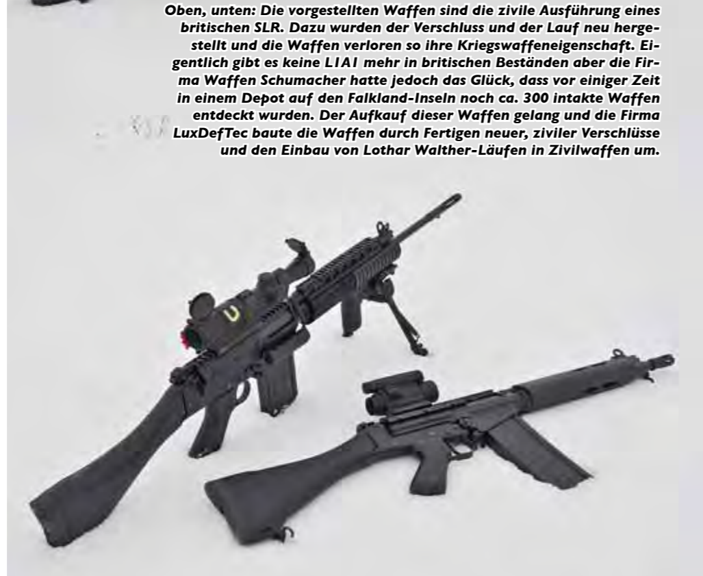
Oben, unten: Die vorgestellten Waffen sind die zivile Ausführung eines britischen SLR. Dazu wurden der Verschluss und der Lauf neu hergestellt und die Waffen verloren so ihre Kriegswaffeneigenschaft. Eigentlich gibt es keine LIAI mehr in britischen Beständen aber die Firma Waffen Schumacher hatte jedoch das Glück, dass vor einiger Zeit in einem Depot auf den Falkland-Inseln noch ca. 300 intakte Waffen entdeckt wurden. Der Kauf dieser Waffen gelang und die Firma LuxDefTec baute die Waffen durch Fertigen neuer, ziviler Verschlüsse und den Einbau von Lothar Walther-Läufen in Zivilwaffen um.