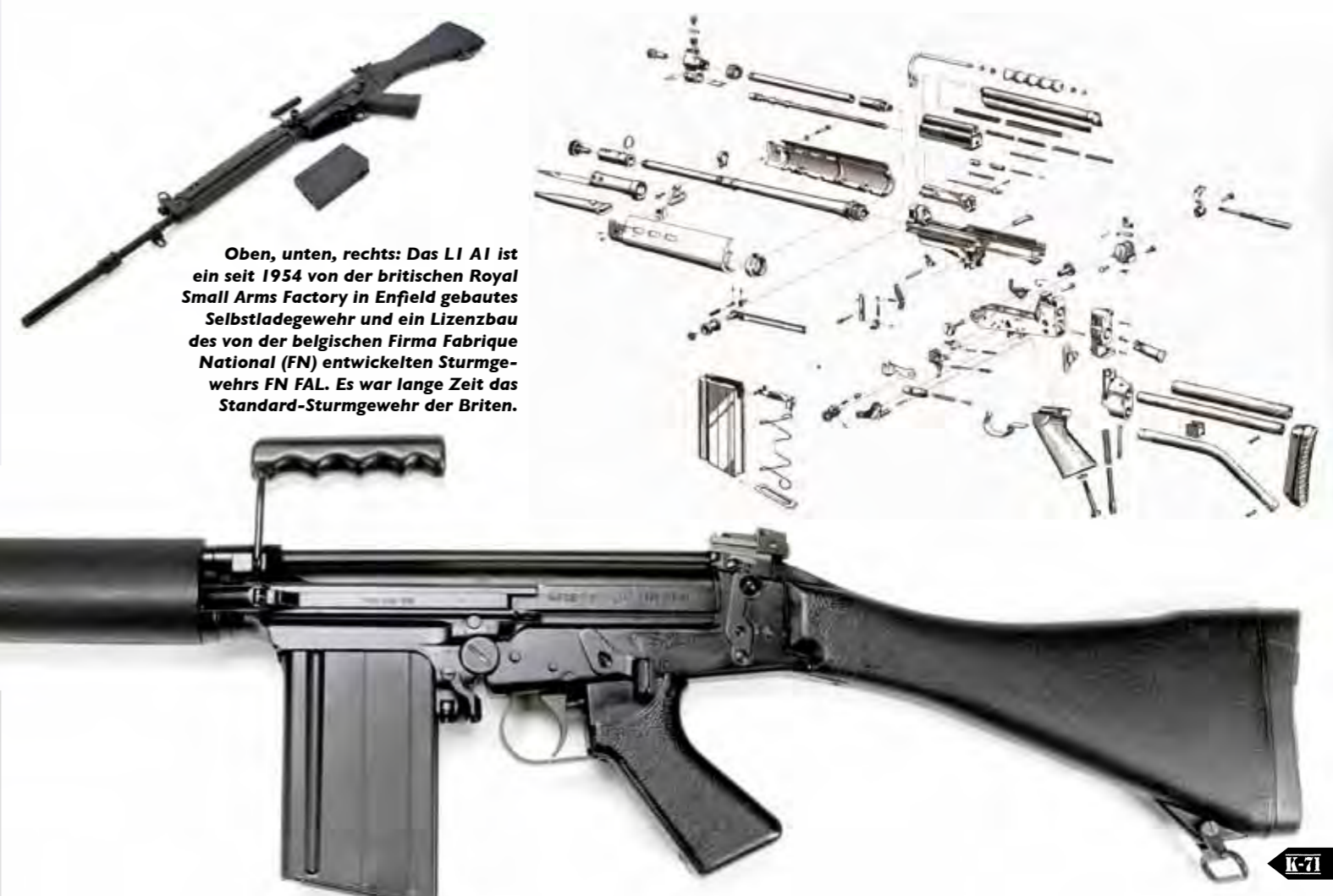
Oben, unten, rechts: Das LIAI ist ein seit 1954 von der britischen Royal Small Arms Factory in Enfield gebautes Selbstladegewehr und ein Lizenzbau des von der belgischen Firma Fabrique Nationale (FN) entwickelten Sturmgewehrs FN FAL. Es war lange Zeit das Standard-Sturmgewehr der Briten.